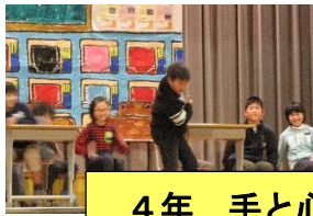
4年 手と心でつながろう