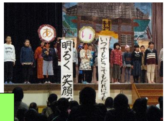
5年 あいさつ日本ー ～タイムスリップした水戸黄門～