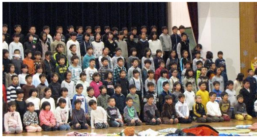
全校合唱 すてきな友達

がくしゅうはっぴょうかい かんそう よ すこ しょう 学習発表会の感想をたくさんお寄せいただき、ありがとうございました。少し紹 介します。