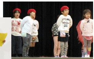
1年 くまのこうちょうせんせい