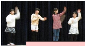
ダンス部 恋ダンス