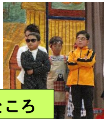
3年 愛南町はいいところ